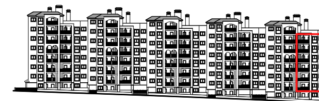
VISTA DESDE AVENIDA REINA SOFIA