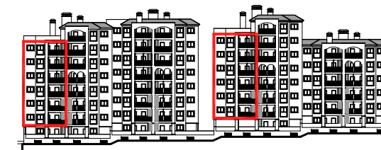
VISTA DESDE ZONA VERDE

130 VIVIENDAS, GARAJES Y TRASTEROS AVENIDA REINA SOFIA ESTEPONA. MÁLAGA